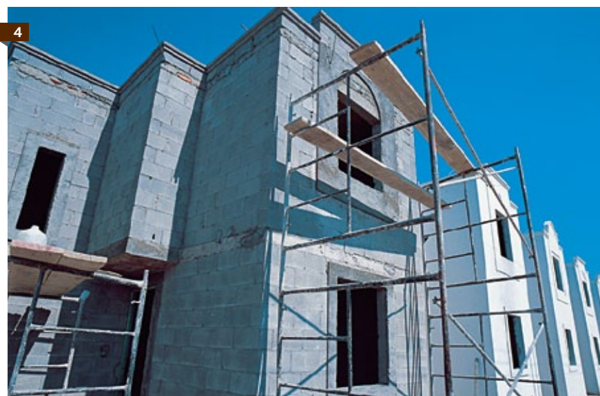
1. Alta calidad en acabados. 2. Casa Habitación, Los Cabos, Baja California Sur. 3. Edificio de Departamentos, Los Cabos, Baja California Sur. 4. Conjunto Habitacional, Reynosa, Tamaulipas.